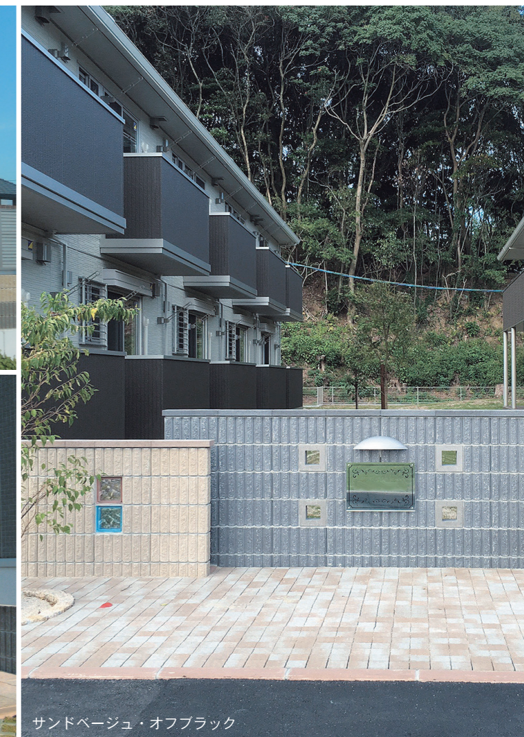
サンドベージュ・オフブラック