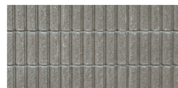
アッシュブラウン