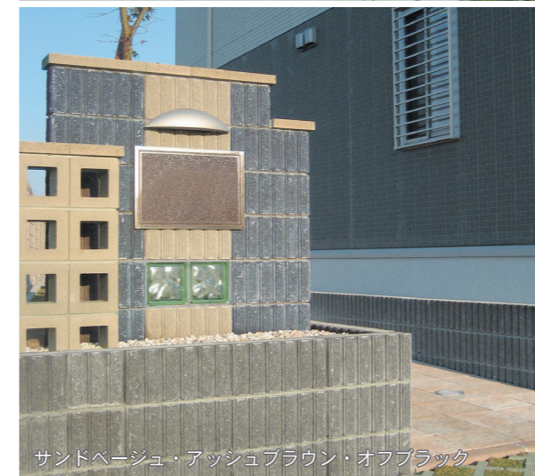
サンドベージュ・アッシュブラウン・オフブラック