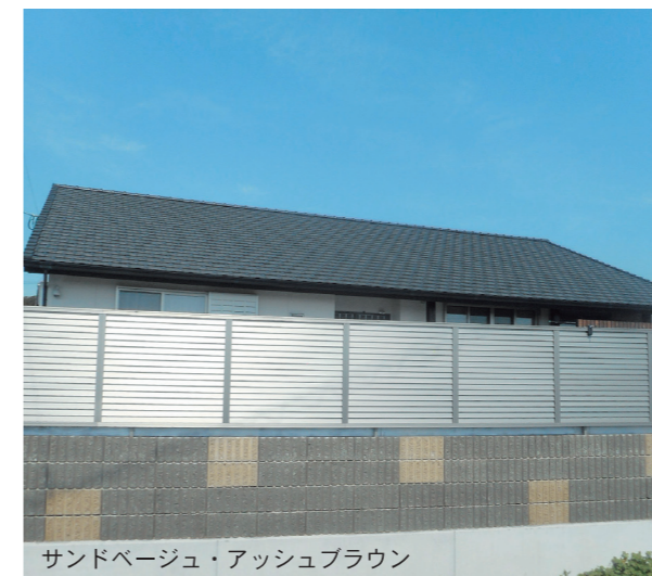
サンドベージュ・アッシュブラウン