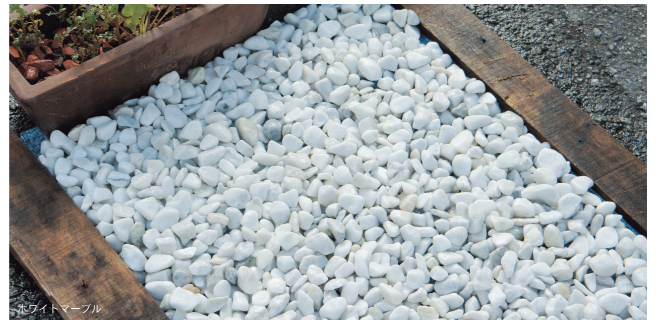
ホワイトマーブル