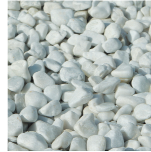
ホワイトマーブル (15mm)