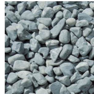
NEW 那智黒玉砂利 (15mm)