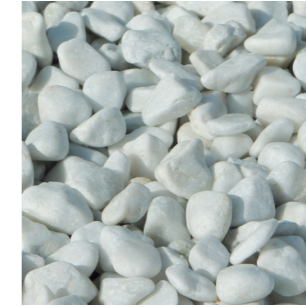
ホワイトマーブル (30mm~50mm)